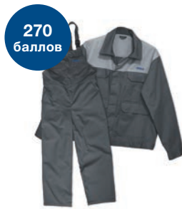
Униформа автослесаря и три пары перчаток