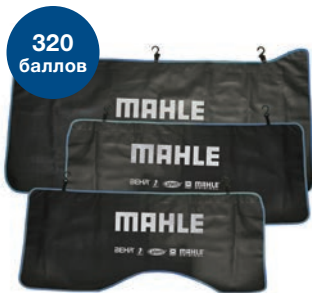
Комплект накидок на автомобиль